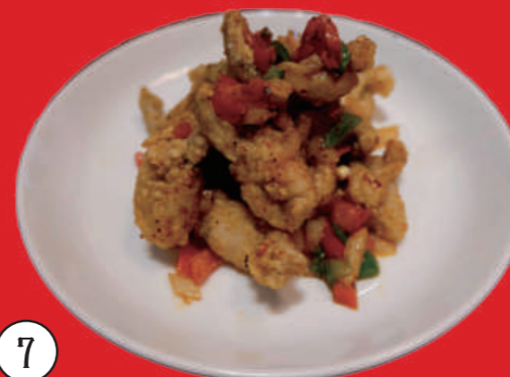
7 椒塩牛蛙 ウシガエルの花椒塩仕立て 2,900 円