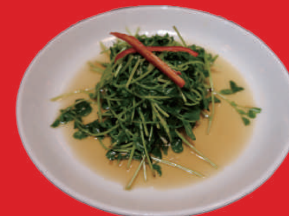
8 白灼豆苗 豆苗のサツと茹で 1,500 円