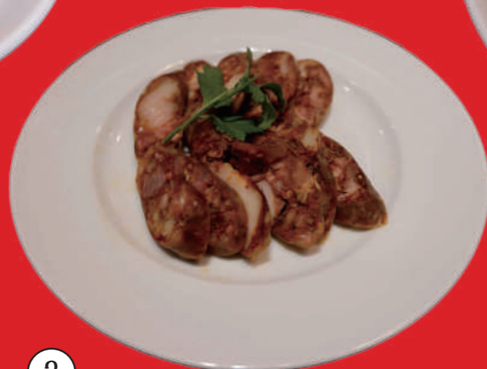
3 四川香腸 四川風麻辣ソーセージ 1,000 円