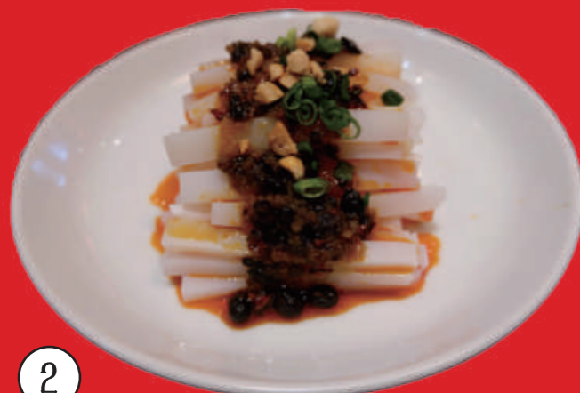
2 川北涼粉 ピリ辛でんぷんスティック 800 円