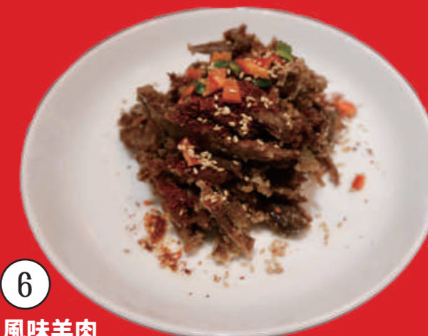
6 風味羊肉 麻辣とクミン香る羊肉炒め 2,500 円