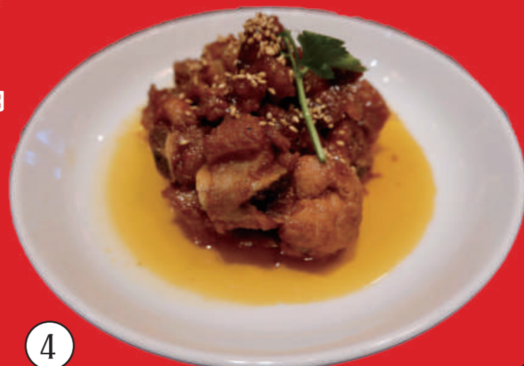
4 糖醋排骨 スペアリブの甘酢煮 1,500 円