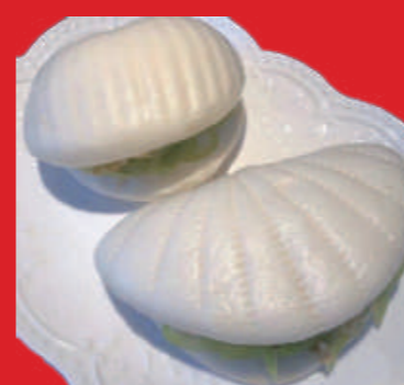
9 荷葉餅 いろいろな料理をつけて挟んで 蓮の葉型マントウ 2 個 580 円