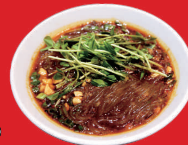
10 酸辣粉 スッパ辛シビ春雨 1,500 円