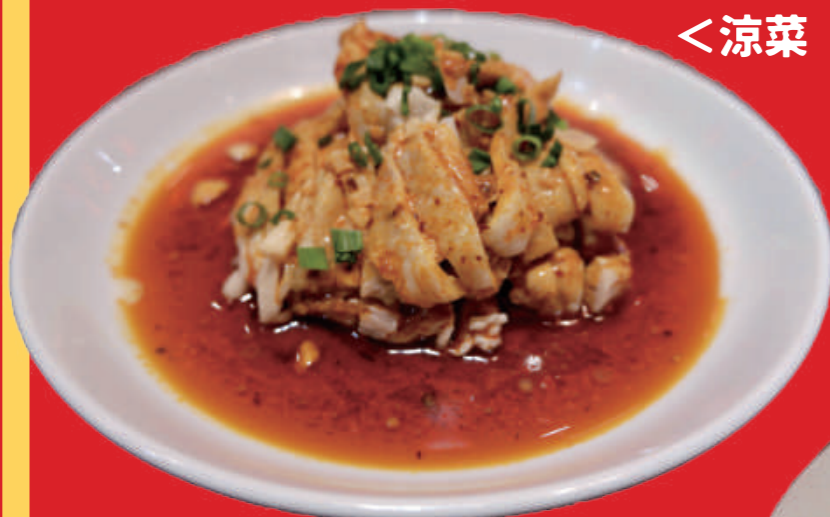
1 口水鶏 よだれ鶏 1,000 円